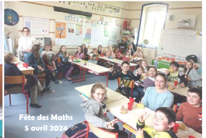
Fête des Maths 5 avril 2024