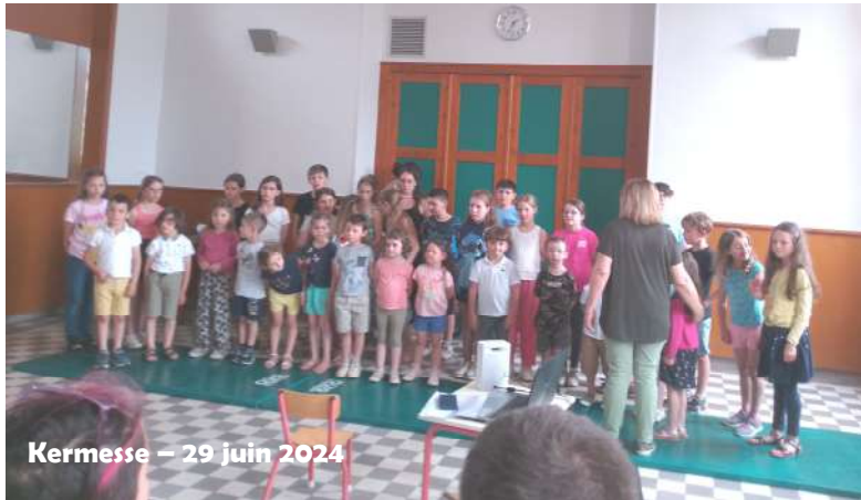
Kermesse - 29 juin 2024