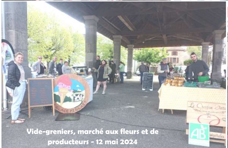
Vide-greniers, marché aux fleurs et de producteurs - 12 mai 2024