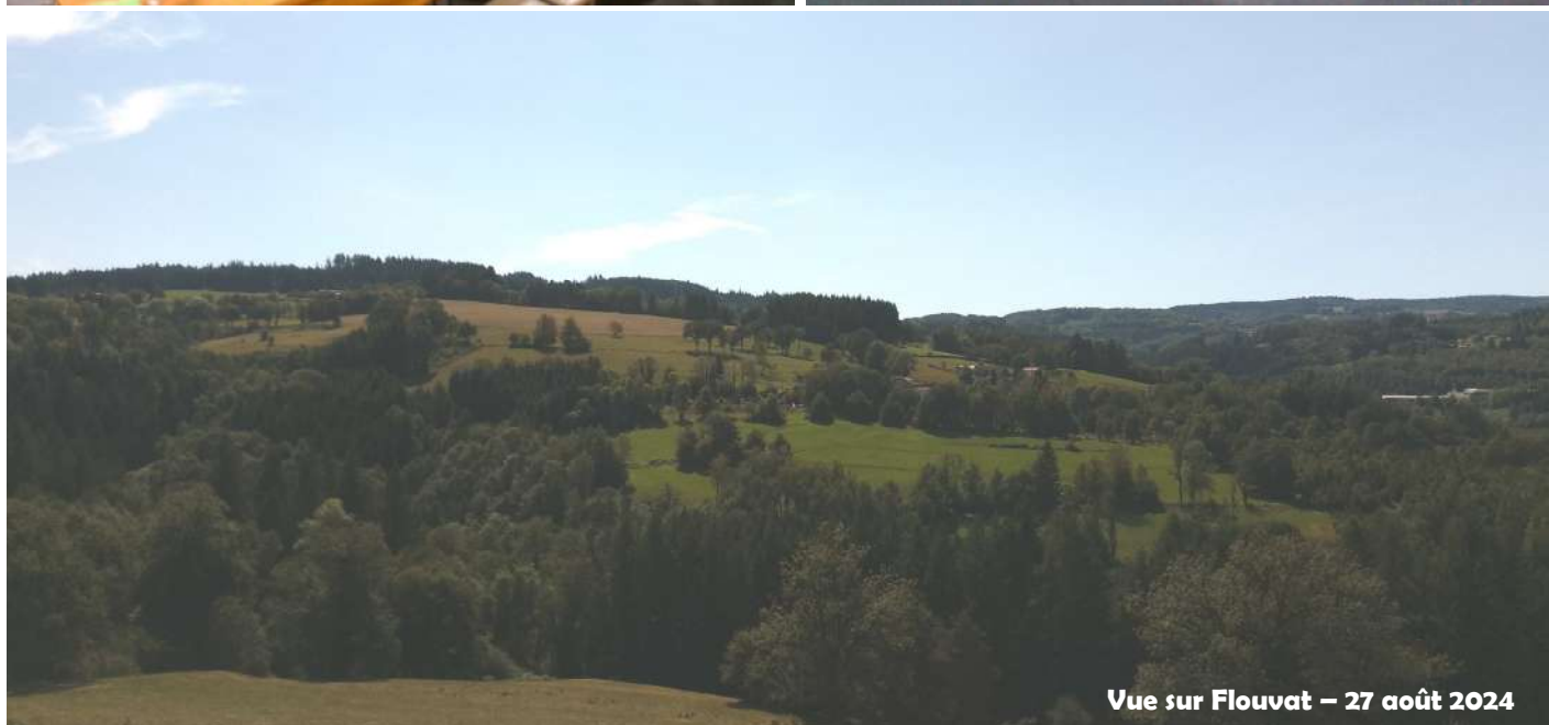
Vue sur Flouvat – 27 août 2024