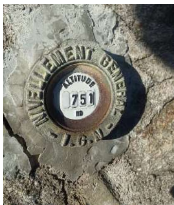
Borne IGN sur le mur de l'école à l'angle de la route du Prat