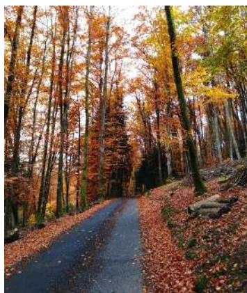
Montée de la route du Grand Bost