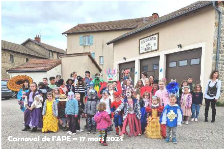
Carnaval de l'APE - 17 mars 2024