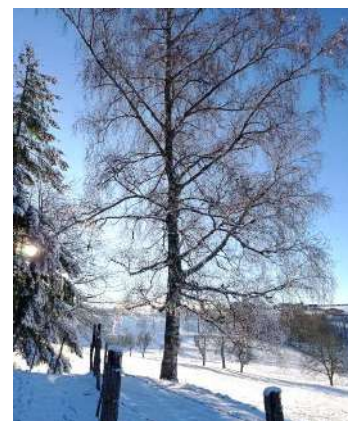
Arbre se situant sur la route à la sortie du Bourg direction Vertolaye