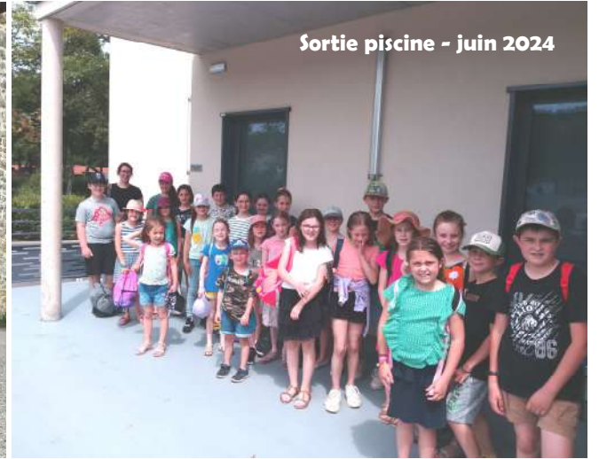
Sortie piscine - juin 2024